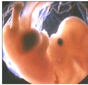
六至到七個星期的胎兒

他是自行發展的。胎兒有自己的血液系統。而胎兒的生命不隸屬於母親的生命，而是另一個獨特的生命。